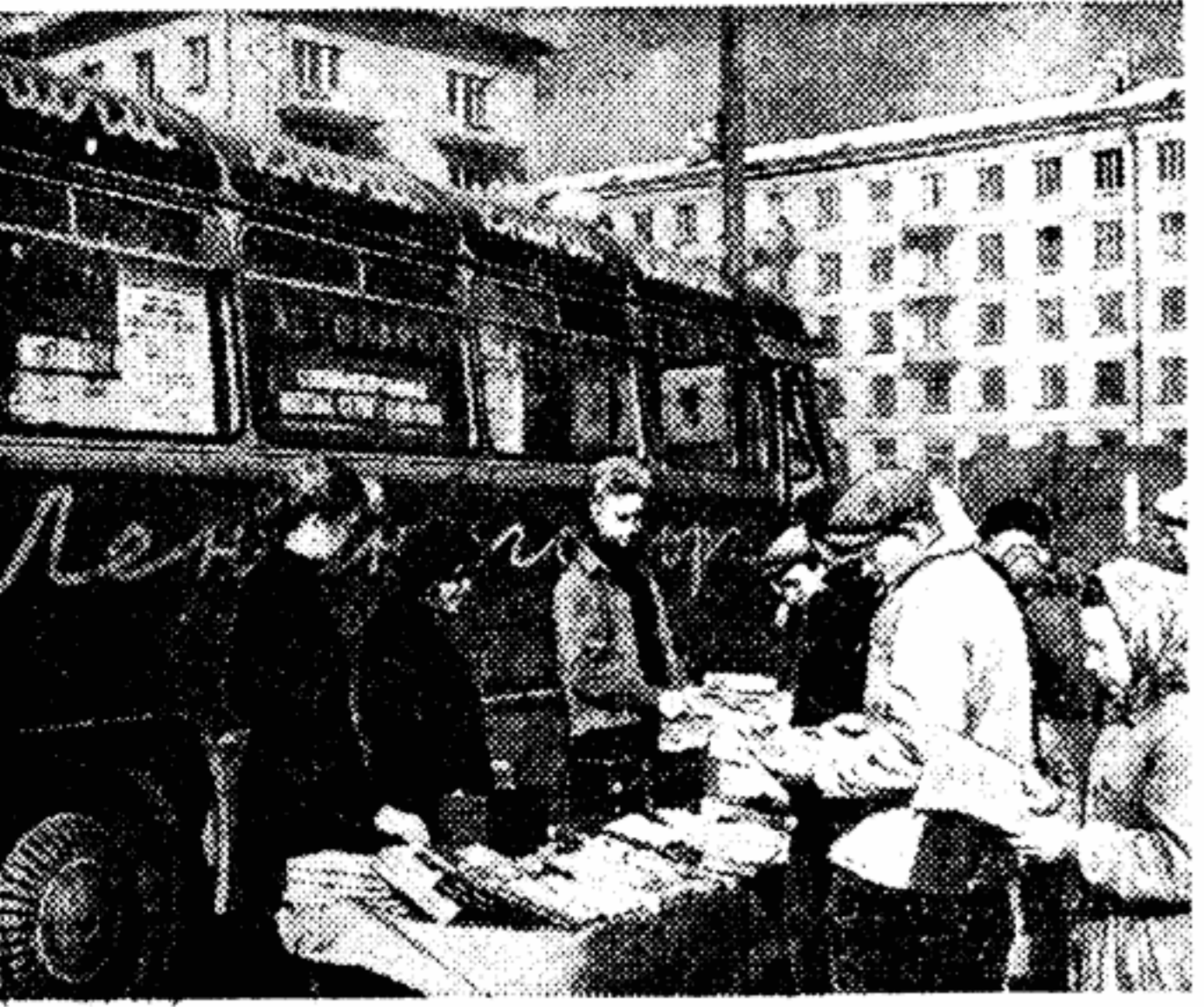
Большой популярностью у ленинградских строителей пользуется автолавка специализированного магазина №19 Ленинского района. Сегодня автолавка приехала на строительную площадку в 10-й квартал Южного района.