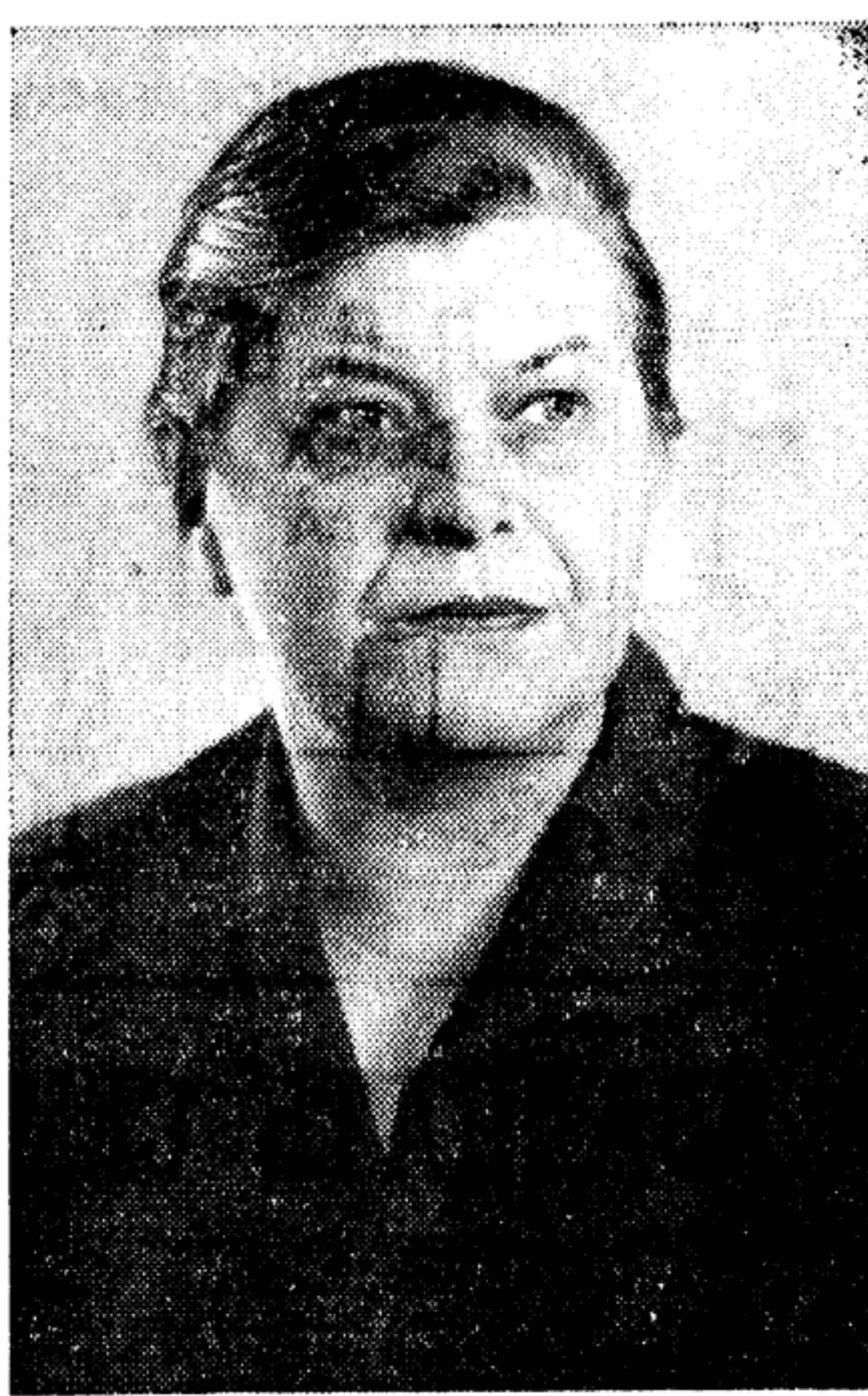
Вера Федоровна Панова