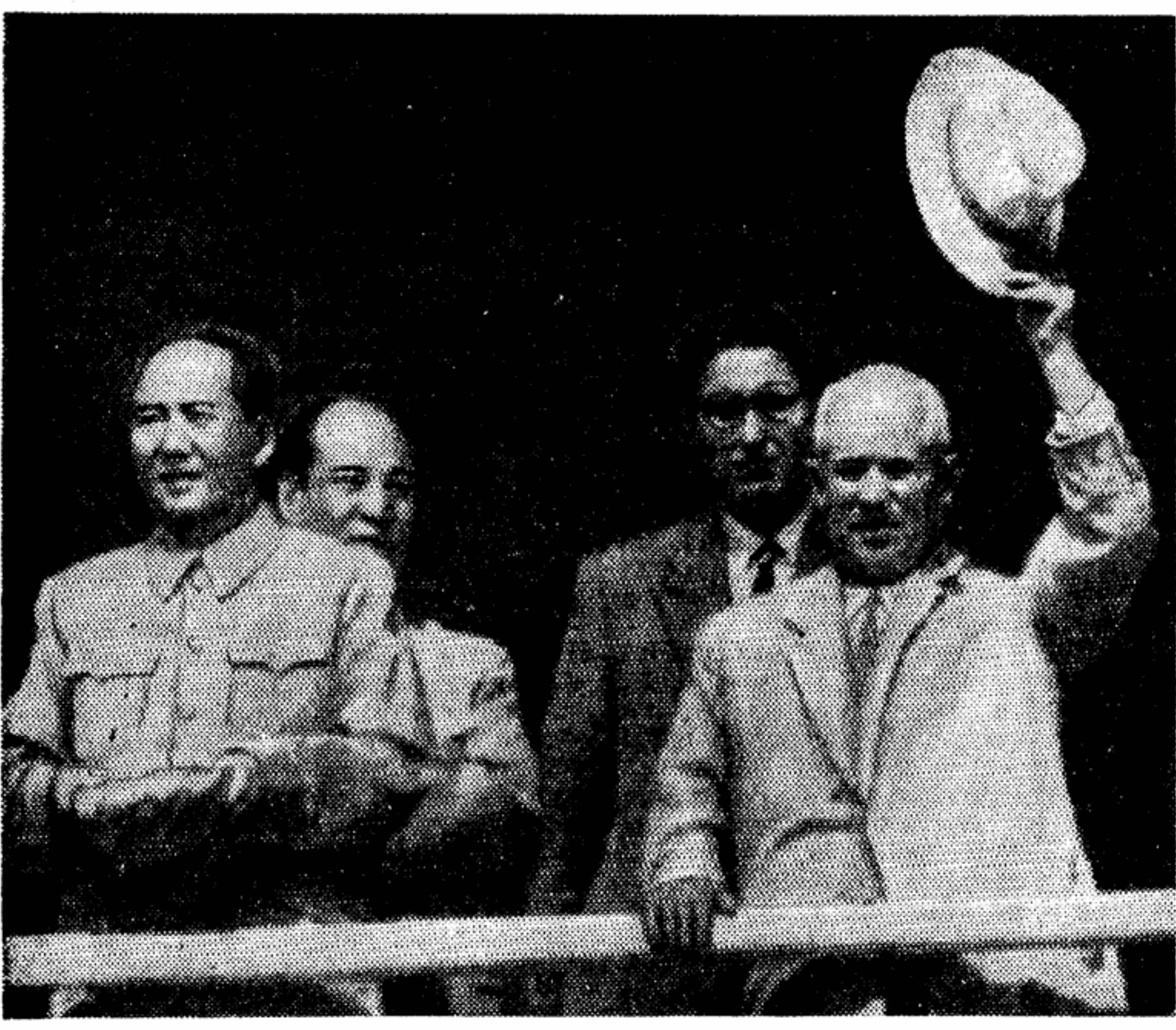
Пекин, 1 октября. Празднование 10-летия Китайской Народной Республики. На трибуне, на площади Тяньаньмэнь — товарищи Мао Цзэ-дун, Н. С. Хрущев.